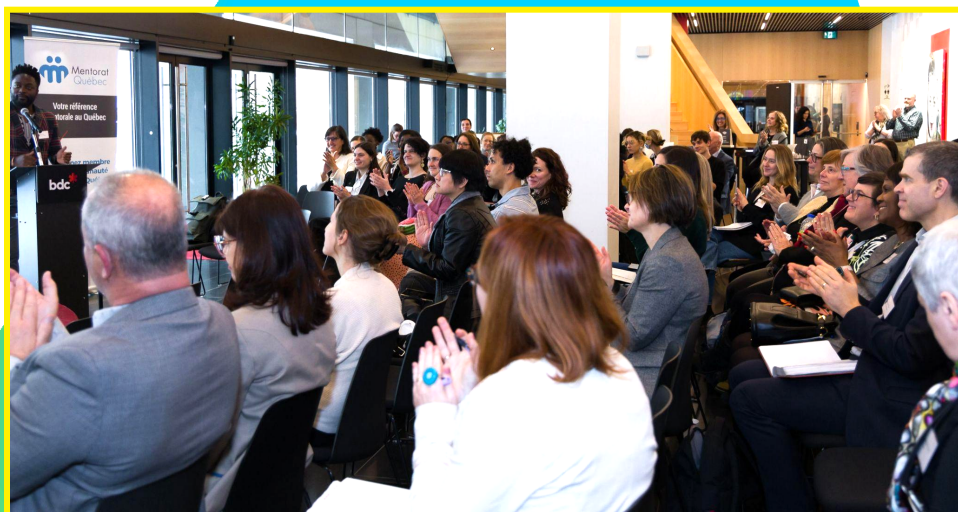
Forum du mentorat, Montréal, janvier 2025

Cette première phase a donc permis de transformer une idée porteuse en un projet structuré, reconnu et déjà influent, positionnant Mentorat Québec comme un acteur de référence en mentorat inclusif.