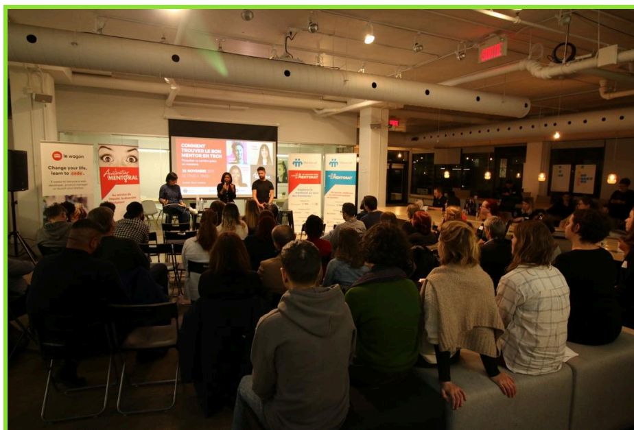
Comment trouver le bon mentor en tech, novembre 2019

Les fondations sont solides, les outils sont éprouvés, la communauté est mobilisée. L'Accélérateur mentorat est prêt à amplifier son impact pour les années à venir et à positionner le Québec comme référence internationale en mentorat inclusif.