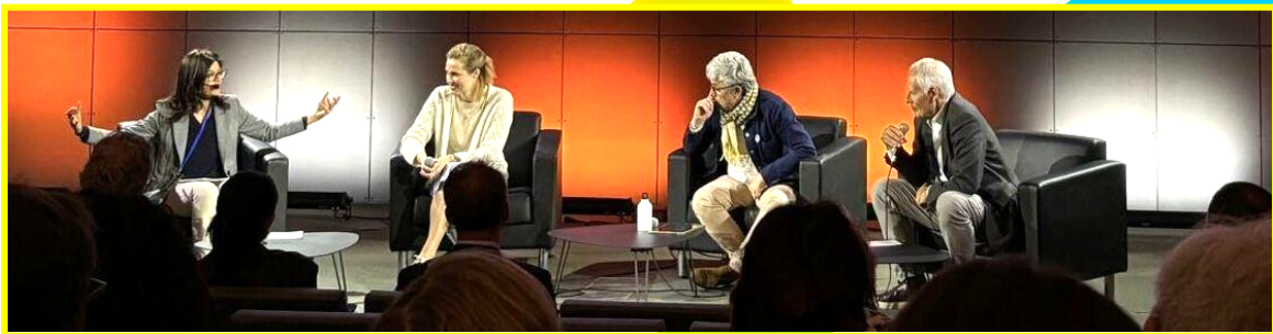
European mentoring summit, Paris, avril 2024