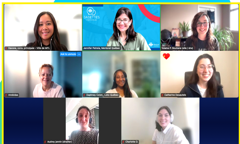
Jasette mentale, mai 2025