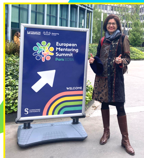
European Mentoring Summit, Paris, avril 2024