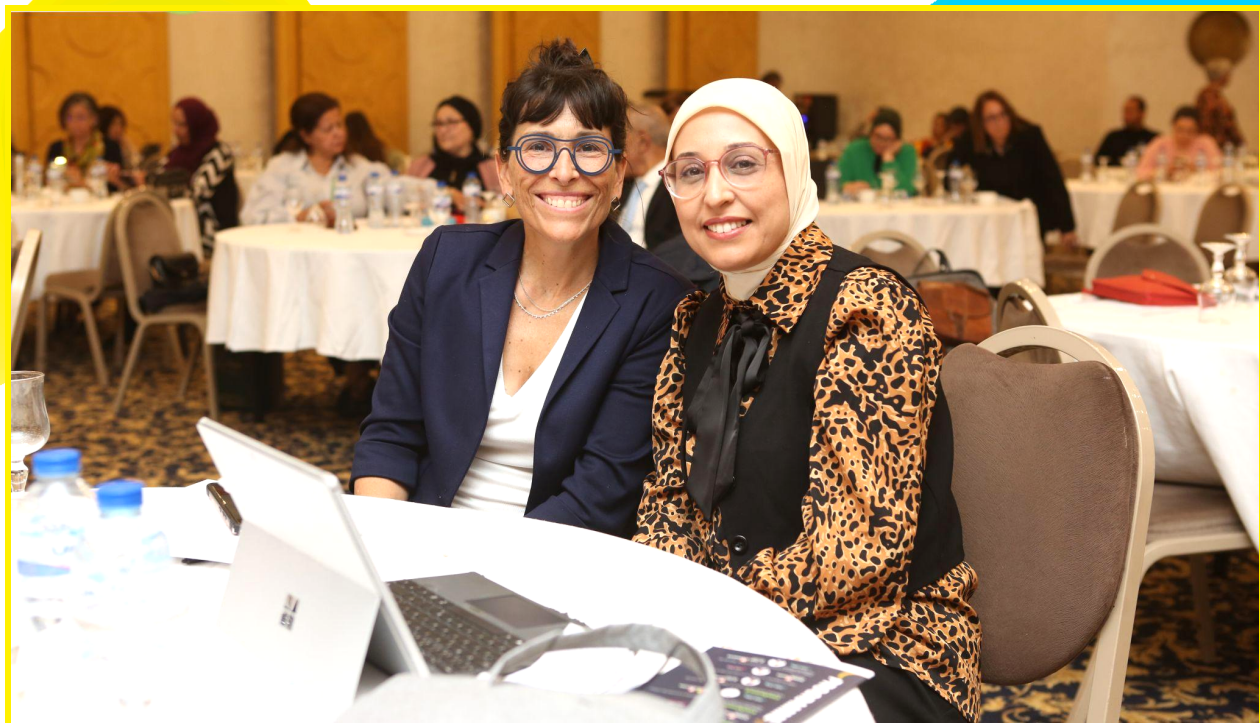
Congrès international ÉDI, Tunis, avril 2025