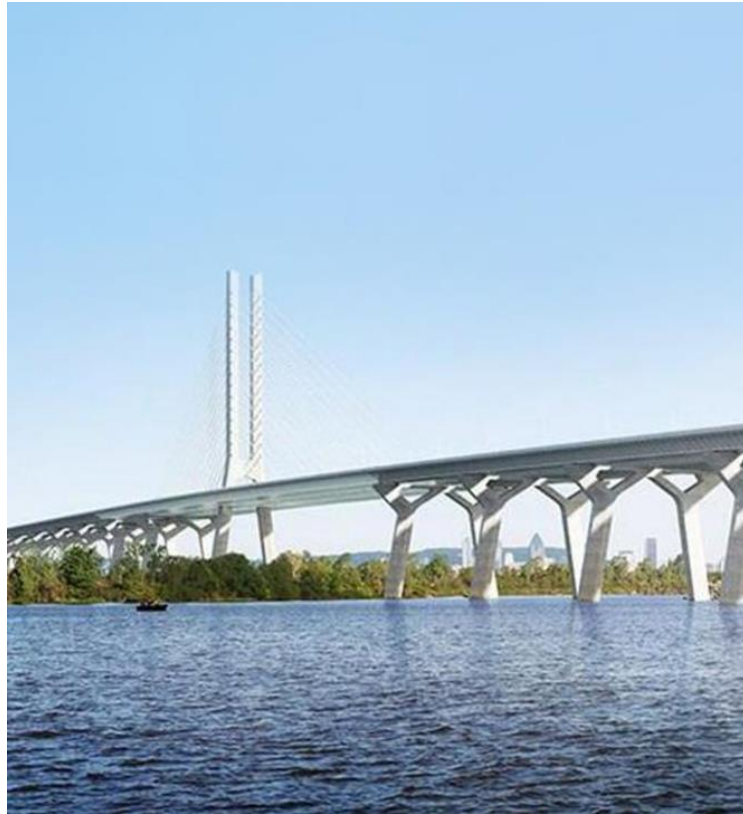
Nouveau Pont Champlain