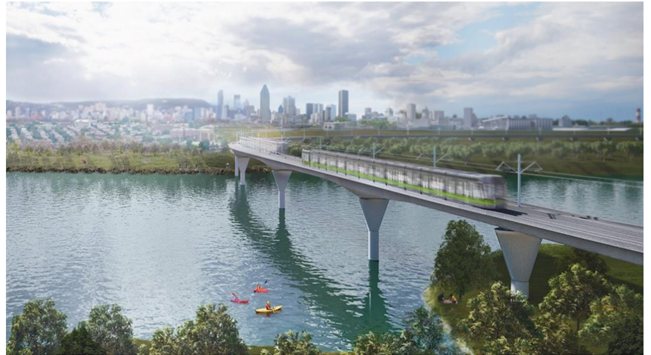
Réseau express métropolitain - REM